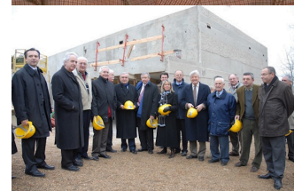
Inauguration du Roc aux sorciers